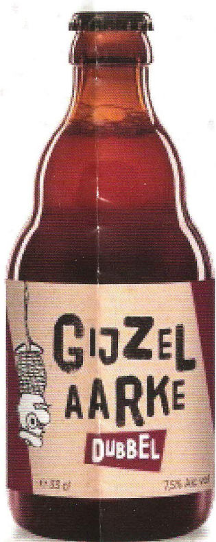
Gijzelaarke Dubbel 7.5%