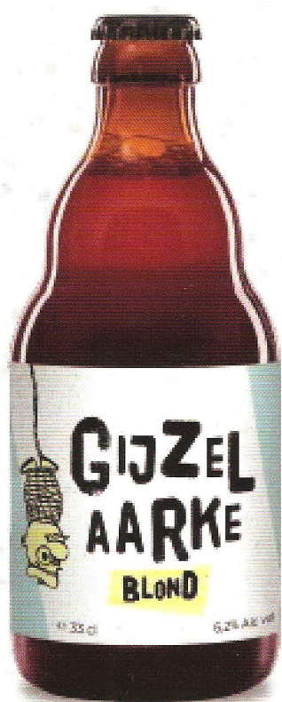
Gijzelaarke Blond 6.2%