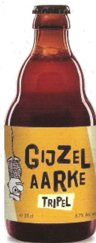
Gijzelaarke Tripel 8.7%